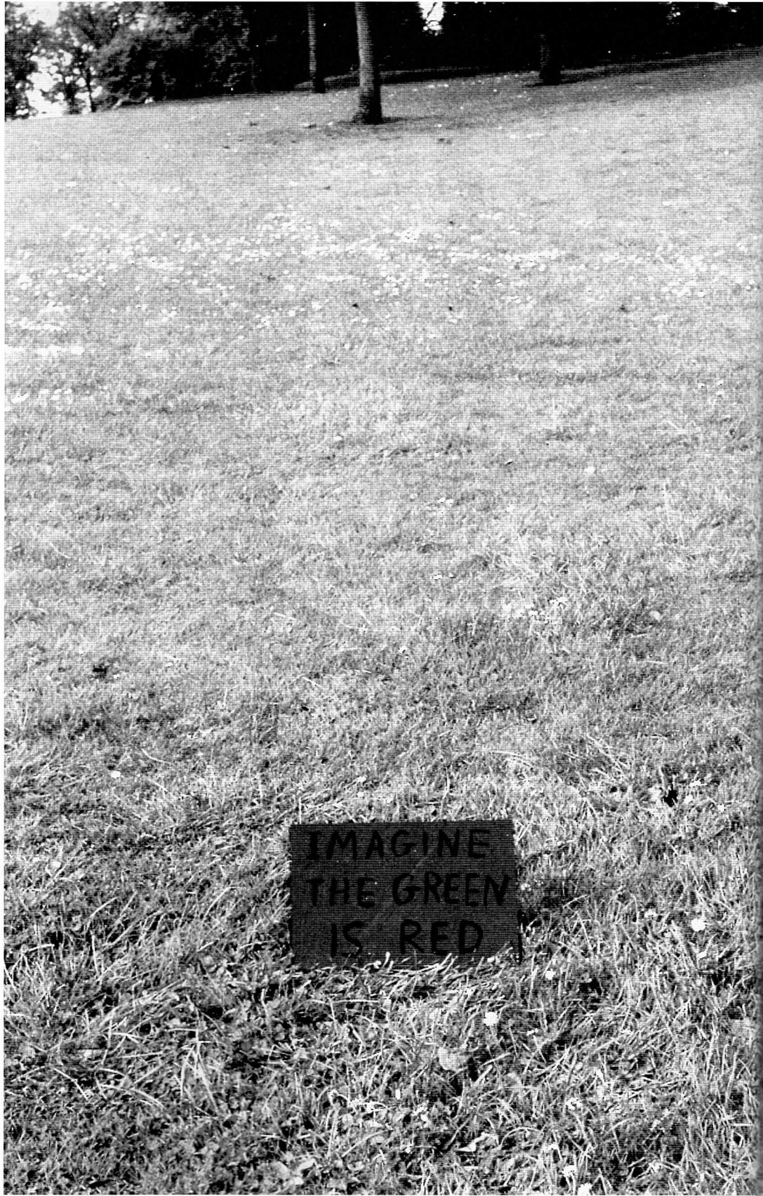
David Shrigley: Untitled, 1990.