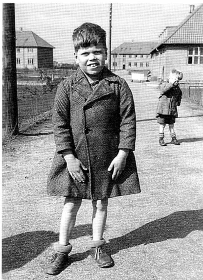
"... pædagogiske indfaldsvinkler skulle have mere plads. Det opfattede nogle af de gamle overlæger som tidlig indblanding i deres virksomhed..."

det primære behandlingsbehov var psykiatrisk og for optagelse og første visitation. Cirkulæret blev rundsendt i 1967. Mange års bitter strid gik forud, og bitterheden mellem de stridende parter blev naturligvis ikke fjernet, selv om kompetencecirkulæret bragte mere ro i feltet.