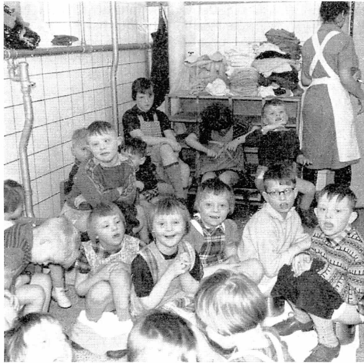
"I 1940'erne og -50'erne opstod der i Danmark en folkelig modstand mod hidtidig praksis indenfor børne- og åndssvageforsorg."

Mange af disse formøder handlede om, hvordan man skulle takle det problem, som forældrenes deltagelse og ageren rundt om på anstalterne udgjorde. Oplevelsen på flere af de store anstalter var, at forældrene blandede sig i sager, som ikke vedkom dem, og at personalet følte deres arbejde kritiseret.