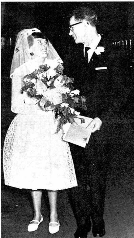
Normaliseringstanken slår igennem – bryllup på Lillemosegård 1967

Den tredje mekanisme Bauman omtaler "nedbryder handlingsobjektet som person. Objektet opløses i egenskaber. Det moralske subjekt reduceres til en samling