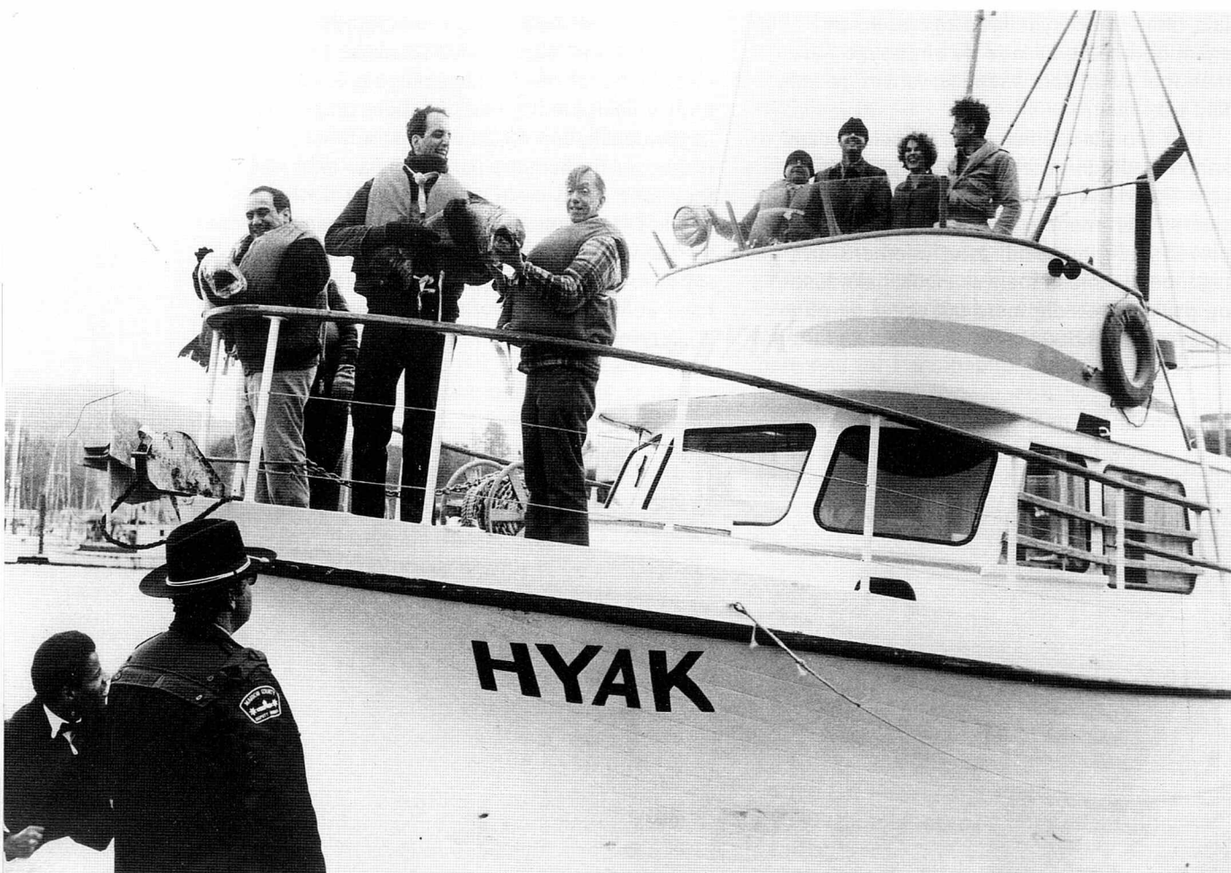
Jack Nicholson på kommandobroen som McMurphy i "Gøgereden". De gale er brudt ud af den totale institution og har overtaget kommandoen over egne liv.

med forlæg i romaner. I de to sidstnævnte tilfælde med romanernes ophavsmænd som manuskriptforfattere på filmene (Ken Kesey med "One Flew Over the Cuckoo's Nest" ragede uklar med Milos Forman). Modsat naturvidenskaben er roman og film polyfoniske, de kan bringe flere forskellige selvstændige stemmer sammen, som alle er lige vigtige. Omend meget forskellige, er de to aktuelle film "Universets engle" og "Elling" nogle vellykkede og velkomne kontrapunktiske bidrag omkring galskab og samfund. Nogle originalt fremførte modstemmer til den naturvidenskabelige monolog.