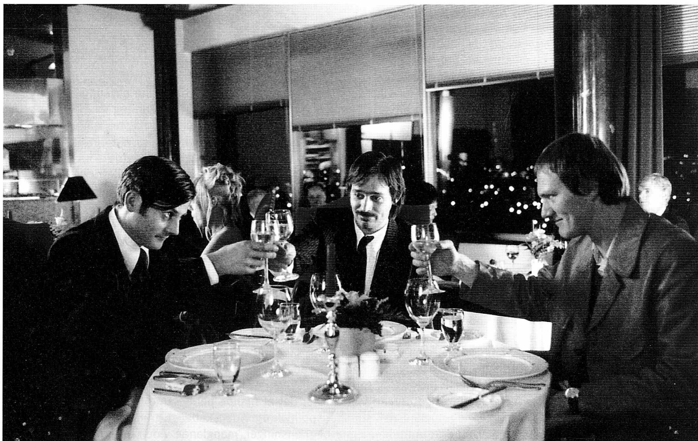
"Normalisering" i filmen "Universets engle": I stedet for at gå til en medpatients begravelse, udnytter tre patientkolløgere fra Reykjavik-anstalten Kleppur terrænfriheden til en empowerment-aktion. Stor middag på Islands dyreste restaurant – uden en krone på lommen.