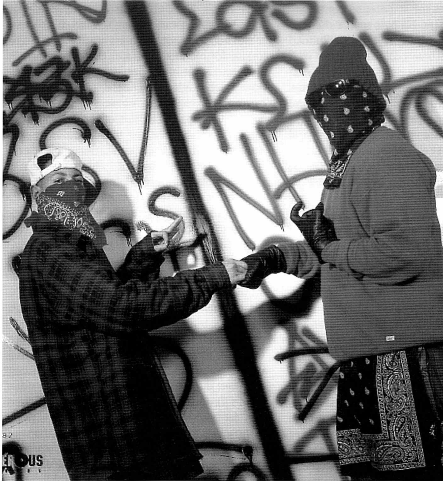
Ungdomsgrupper i Holland med etnisk minoritetsbaggrund, først og fremmest surinamesere og unge med forældre indvandret fra Antillerne, portrætterer sig selv ud fra amerikanske ghetto-forbilleder.

spottet, og det er jeg faktisk glad for, for ellers var der flere af dem, der ville være endt i fængsel. Og i en vis forstand er det også misvisende at betegne dem som en gruppe. Der er snarere tale om et åbent – og til en vis grad egocentreret – netværk, hvis sammensætning kan ændre sig fra dag til dag. De plejede at mødes hver onsdag aften ved endestationen, hvorefter de tog med sporvognen til andre lokalsamfund for at mødes med deres venner fra de andre boligområder. Så i deres øjne er der slet ikke tale om en gruppe. Det er bare nogle venner, der