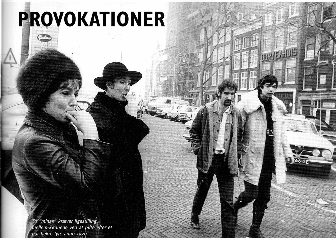
To "minas" kræver ligestilling mellem kønnene ved at pifte efter et par lækre fyre anno 1970.