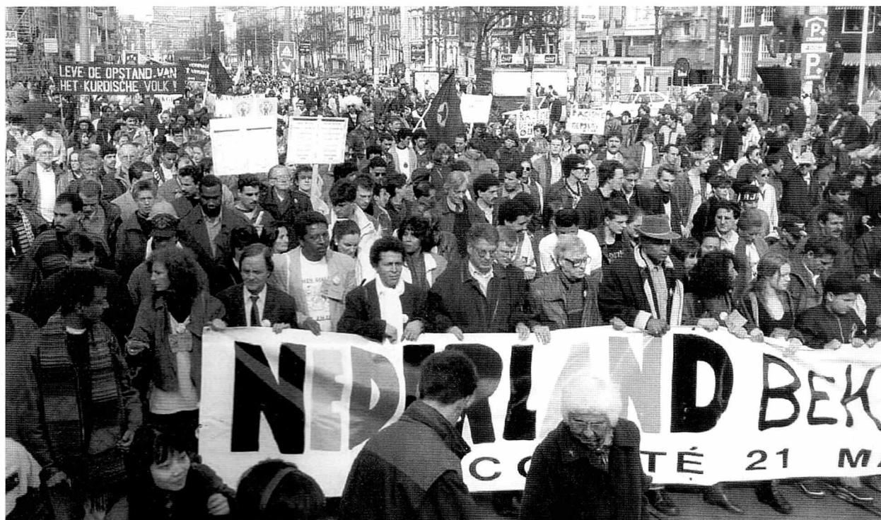
50.000 mennesker "bekender kulør" d.21. marts 1993 ved en demonstration i Amsterdam vendt mod racisme.