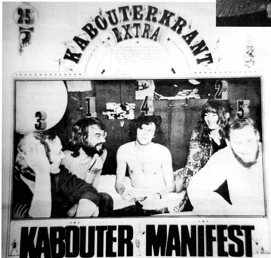
Kabouternes politiske manifest havde mange lighedspunkter med den oprindelige Christiania fristad herhjemme.

er på vej væk fra den traditionelle narko-kontrolpolitik til fordel for en tillæmpet hollandsk model. Ikke mindst indenfor det store og politisk sprængfarlige narkotika- og hashområde, har hollænderne demonstreret at en blød politik med at give bemyndiget lov til andre former for rus end den alkoholiske brandert, kan være en måde at udøve kontrolpolitik på som på kvalificeret vis kan konkurrere med forbudspolitikken.