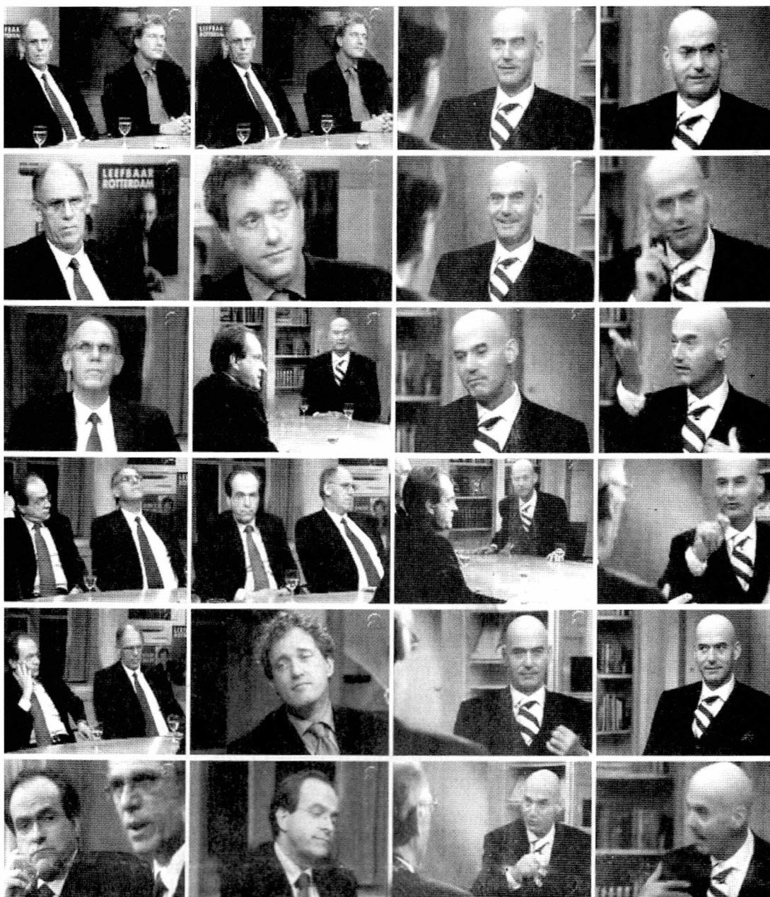
Pim Fortuyns homoseksuelt baserede kropsbevidsthed og frie kommunikation foran de snurrende kameraer, efterlod de etablerede politiske partiers ledere som umælende og forskræmte kropspansrede jakkesæt. Den store avis De Volksrant har affotograferet politikernes kropssprog i en tv-diskussion.

*) Der lever 16 millioner mennesker i Holland på et område, der er mindre end Danmark. Indvandrere udgør omkring 10% af befolkningen, mere end i både UK og Frankrig, med en rekordstor tilgang af 133.000 nye indvandrere i 2000. For Amsterdam og Rotterdams vedkommende er tallet ca.35%. Godt 30% er romersk-katolske, godt 20% protestanter.