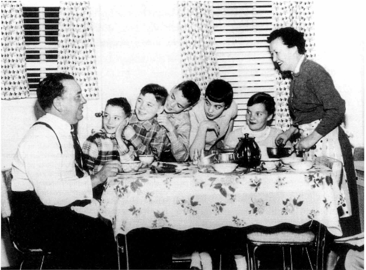
Legendariske Richard J. Daley med familien samlet omkring sig hjemme i Bridgeport "neighborhood" efter at være blevet valgt som borgmester i 1955. Drengen i midten er sønnen og nuværende borgmester Richard M. Daley.

Så det er ikke så mærkeligt at der er politiske interesser, der konkurrerer i byrådet; folk ser ofte byrådet som et cirkus, et godt teater der sommetider er politik. Der er en overvældende majoritet af demokrater i byrådet, så Chicago holder hånden over sit system med at folk kan give jobs til familien – og det er helt sikkert typisk for Chicago politik. Jeg tror nu ikke, det gælder nær så meget som for 25 år siden. Men vi ved stadig hvordan vi kommer igennem med at mobilisere denne "demokratiske maskine", og folk ved hvem der betaler deres løn, og jah, det er så typisk Chicago. Men hvis du gik ud til valgstederne på stemmedagen, ville du finde fordømmelse af det fra begge sider. Vi har demokratisk primærvalg i denne uge, og vi har republikansk primærvalg, men der er selvfølgelig ingen republikansk kandidat der har