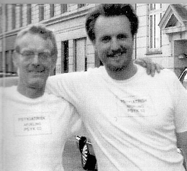
redaktionsmedlemmer ikke fotograferes med den på ...

ikke gjorde så meget set fra firmaets synspunkt. Alene al den presseomtale den forbudte kampagne fik, betød en stigning i salg på 50%.