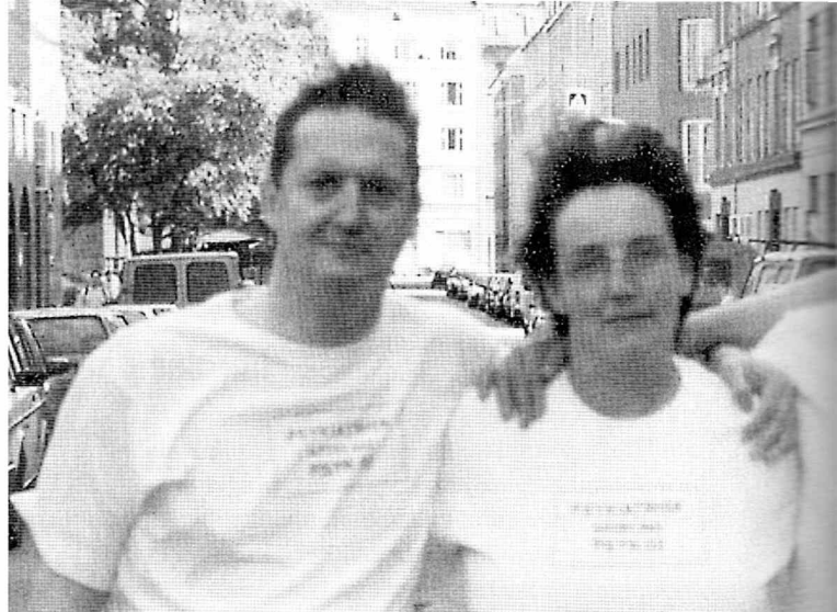
Outsiderens redaktion bakker kontroversiel T-shirt op, dog ville tre