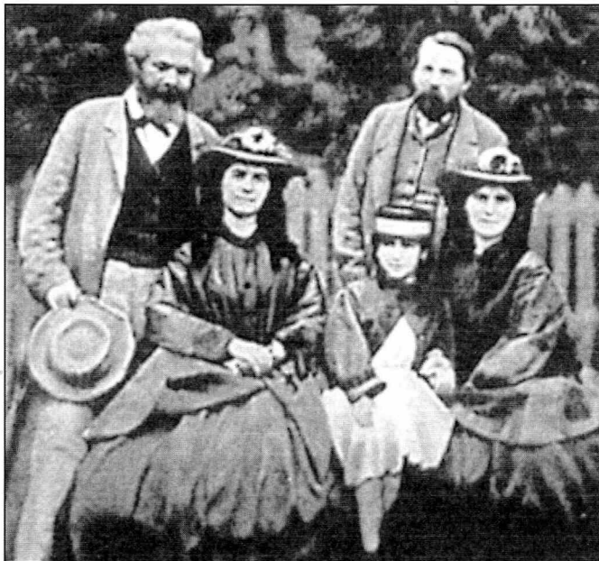
Foto af Karl Marx, Friedrich Engels og Marx's døtre, Laura, Eleanor og Jenny i maj 1864

uden folk, for arbejderklassen – dvs folk der til dagligt var beskæftiget med manuelt arbejde – havde Marx ikke meget at gøre med.